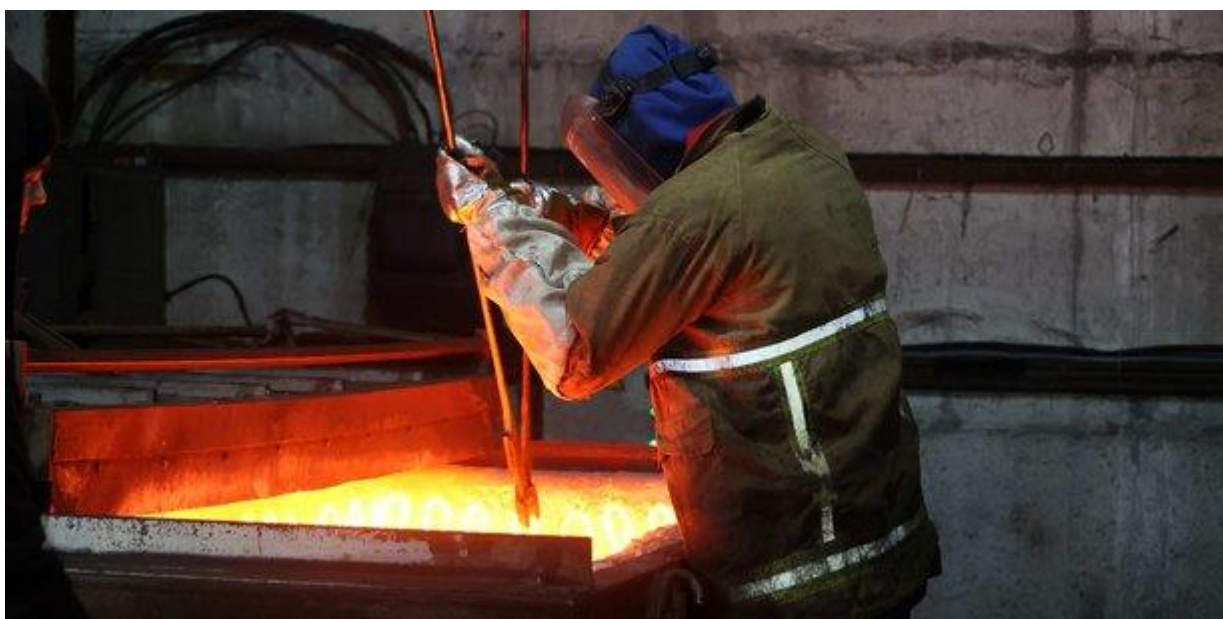
Un ouvrier dans une usine d'armement de Kharkiv, le 16 mars.

Kiev a confirmé la semaine dernière la chute abyssale de son PIB de 29,1% en 2022. L'activité du pays ne s'est toutefois pas totalement écroulée. Grâce à l'aide internationale et à la relocalisation de l'économie à l'ouest du pays, employés et patrons tentent de maintenir l'économie debout pour donner les moyens à la nation de résister à la guerre que mène la Russie sur son territoire.